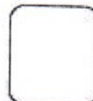
FUJELLA DIGITAL ÍNDICE DERECHO