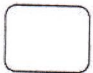
HUELLA DIGITAL ÍNDICE DERECHO