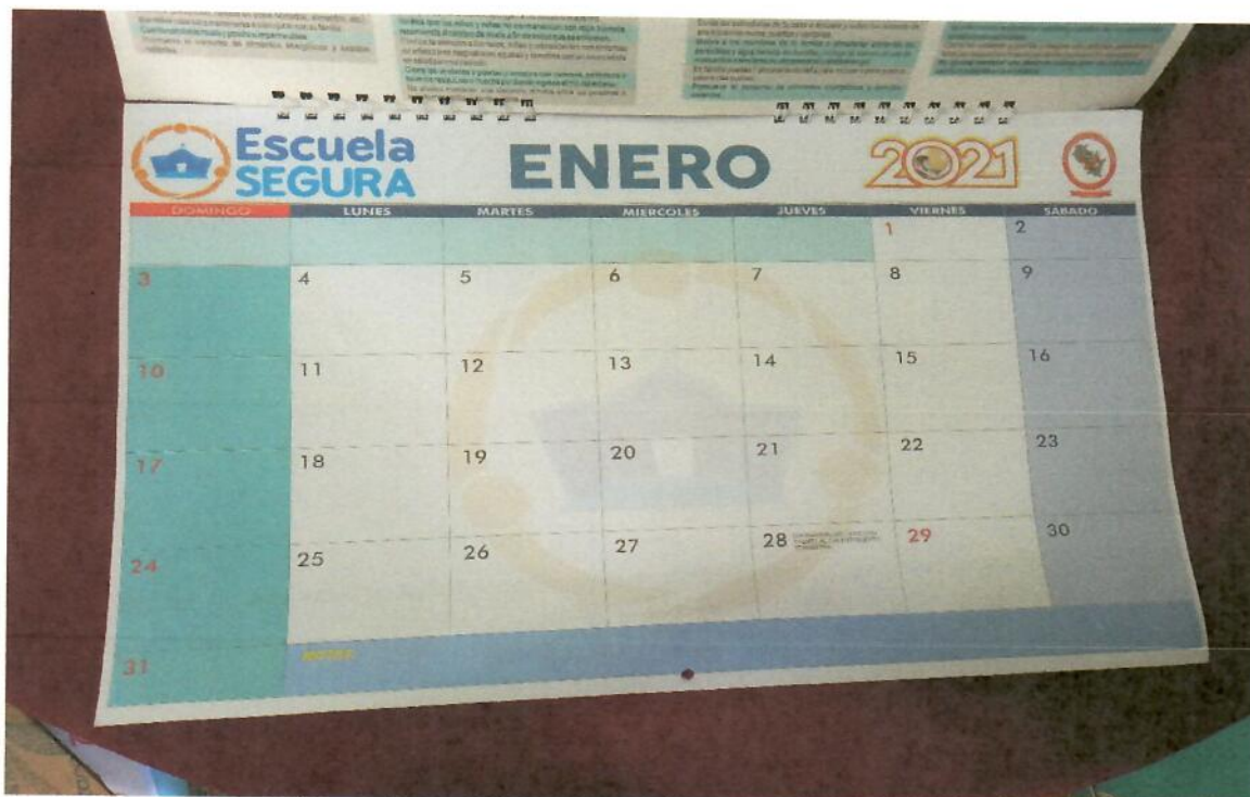
LOGO PP068 PREVAED